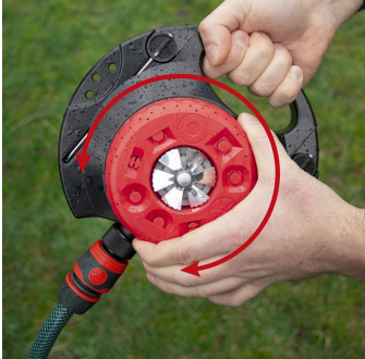
Sprühbilder durch Drehmechanismus wählbar